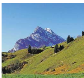
Blick von der Orenplatte auf den Ortstock.

Vorbei an der Talstation der kleinen Luftseilbahn zum Brunnenberg und weiter aufwärts und aufwärts und