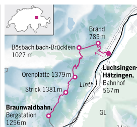
Grafik: nitz

aufwärts: Dies ist eine strenge Wanderung. Nach dem nördlichsten Punkt Bränd, von dem Weg dreht, geraten wir auf eine Gerade im Wald. Weiter oben lauert das Hölloch, das die Wegmacher genial bewältigt haben. Zur Rechten erhebt sich eine überhängende Felswand, Vorsicht, Wandererkopf! Und zur Linken stürzt der Tobelhang dra-